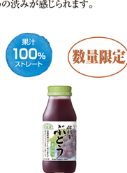
ぶどう 果汁 100% (ストレート)

信州のぶどうだけで作りました。ぶどうを皮ごとあらほりし、果肉感を残しましたので、甘味のなかにも、ぶどうの渋みを感じられます。