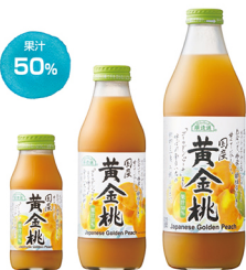
黄金桃 果汁 50%