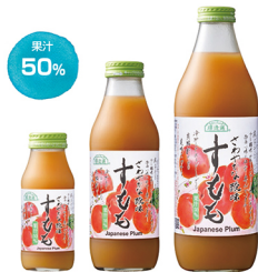
すもも 果汁 50%