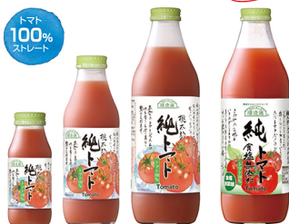
純トマト トマト 100% (ストレート)