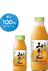
三ヶ日みかん 果汁 100% (ストレート)