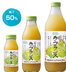
ラ・フランス 果汁 50%

国産の香り一杯のラ・フランスを飲物にしてみました。ラ・フランスの果肉感一杯です。